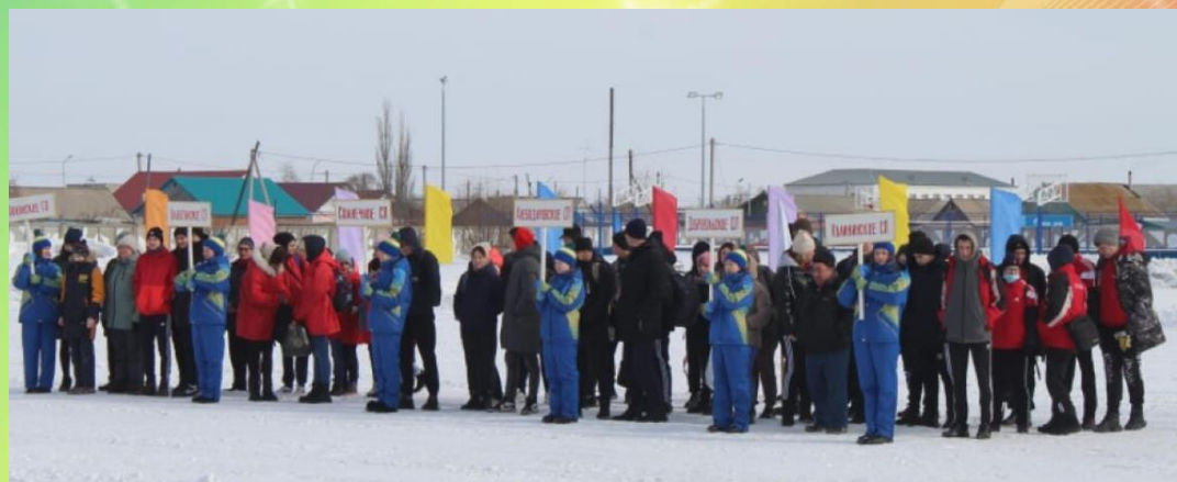
«Самые красивые, самые спортивные»