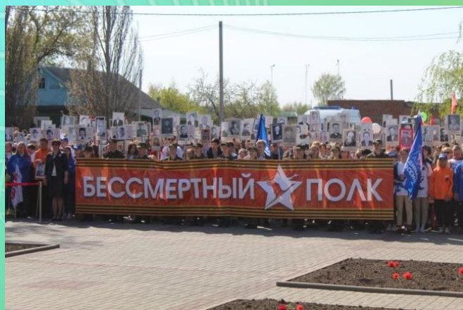
«По дорогам войны»